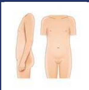
यौवन से पहले