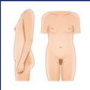
यौवन के प्रारंभिक परिवर्तन