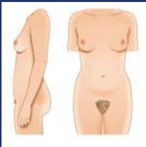
पूरी तरह से विकसित युवा महिला