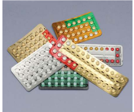
विभिन्न मौखिक गर्भनिरोधक गोलियाँ

“गोली” एक गर्भनिरोधक तरीके से भी काम करती है। संभावित मूड परिवर्तन या वजन बढ़ने के बुरे असर को कम से कम होने के लिए अनेक में से कोई एक हॉर्मोन वाली गोली उचित या संतोषजनक पाई जा सकती है।